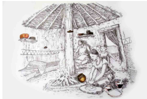
Primera Edad Hierro